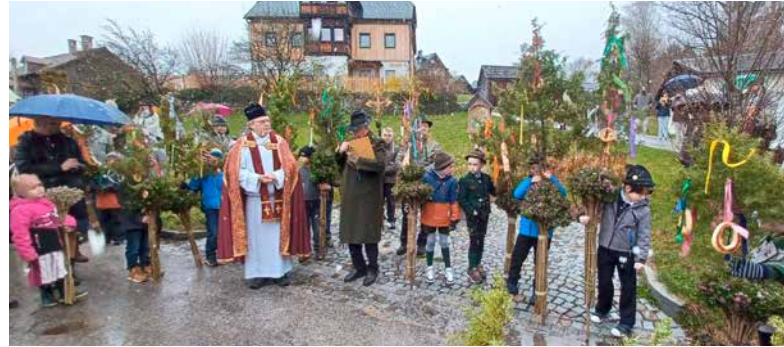
das Binden der wunderschönen Palmbuschen.