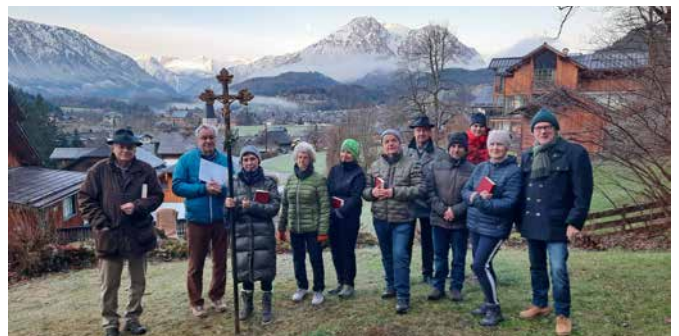
Traditioneller Kreuzweg am Karfreitag in Altaussee zum Kalvarienberg