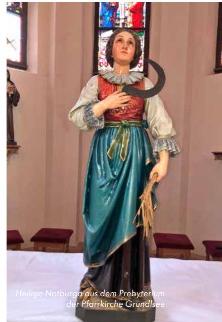
Heilige Notburga aus dem Prebyterium der Pfarrkirche Grundlsee

Eine Reihe von Wundern werden ihr zugeschrieben: Die Holzspan-, Ochsen- und Sichelwunder. Notburga wird seit ihrer Heiligsprechung durch Papst Pius IX. am 27. März 1862 als Patronin der Dienstmägde, der Bauern, der Armen und der Landwirtschaft verehrt, ihr Gedenktag ist der Sonntag nach dem 13. September und ihre Attribute sind Sichel, Schlüsselbund, Getreidegarben, die Schürze mit Brot und die Wasserkanne (an Hand dieser Attribute konnte ich sie