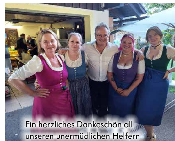
Ein herzliches Dankeschön all unseren unermüdlichen Helfern